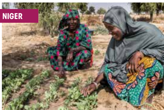
Progetto della Cooperazione italiana in Niger.