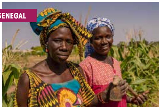
Progetto della Cooperazione Italiana in Senegal.