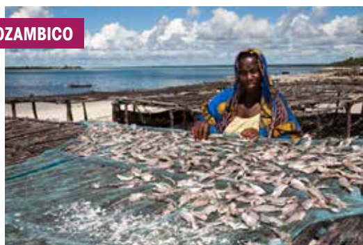
La pesca è un'attività fondamentale per l'autosussistenza e per il commercio nelle aree costiere del Paese.

Il presente documento è stato redatto dall'Agencia Italiana per la Cooperazione allo Sviluppo con il concorso della Direzione Generale per la Cooperazione allo Sviluppo (DGCS) del Ministero degli Affari Esteri e della Cooperazione Internazionale (MAECI). La redazione del documento ha previsto un processo di consultazione, coordinato dalla DGCS del MAECI, con le Organizzazioni della Società Civile e con il gruppo di lavoro "Strategie e linee di indirizzo della cooperazione italiana allo sviluppo" del Consiglio Nazionale per la Cooperazione allo Sviluppo (CNCS), che hanno contribuito all'elaborazione del testo attraverso successive revisioni. Si ringraziano tutte le parti intervenute nel processo.