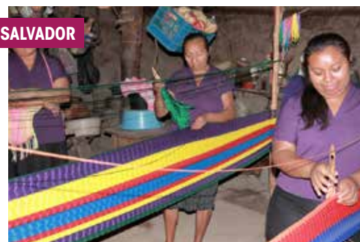
Progetto della Cooperazione Italiana in El Salvador.