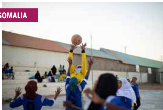
Progetto della Cooperazione Italiana in Somalia.