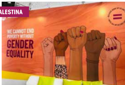
Progetto della cooperazione italiana in Palestina. Foto di Guia Faglia, in occasione di un meeting sulla campagna dei 16 giorni